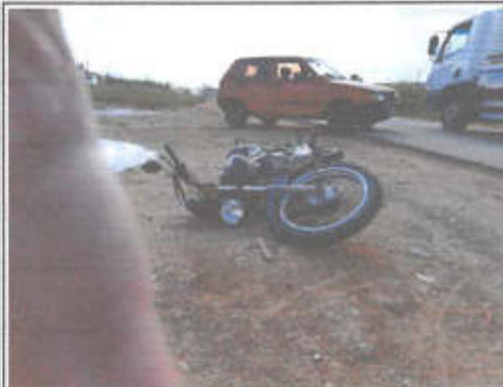
IMAGEM DA FRENTE