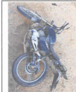
IMAGEM DA LATERAL ESQUERDA