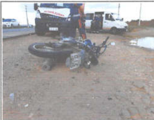
IMAGEM DA TRASEIRA