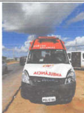
IMAGEM DA FRENTE