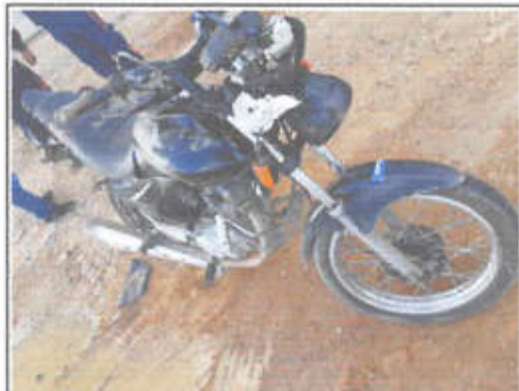
IMAGEM DA LATERAL DIREITA