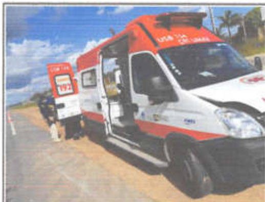
IMAGEM DA LATERAL DIREITA