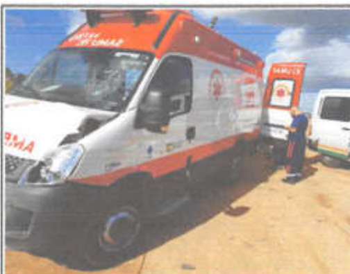
IMAGEM DA LATERAL ESQUERDA