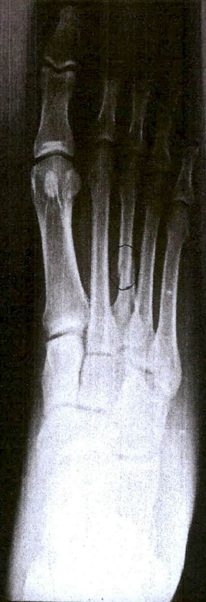
NOTICE:JPEG image for reference. Not for diagnostic use.