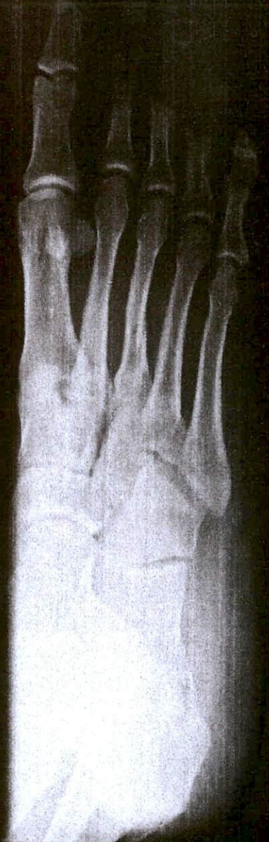
NOTICE:JPEG image for reference. Not for diagnostic use.

FLS. 15 SECRETARIA DA 2ª VARA CÍVEL 100 NORTE-CE