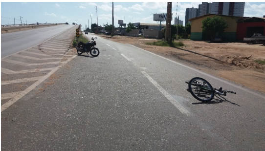
IMAGEM COMPLEMENTAR 01