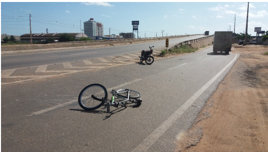
IMAGEM COMPLEMENTAR 01