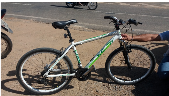
IMAGEM COMPLEMENTAR 01