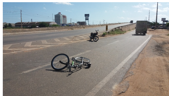
IMAGEM COMPLEMENTAR 02